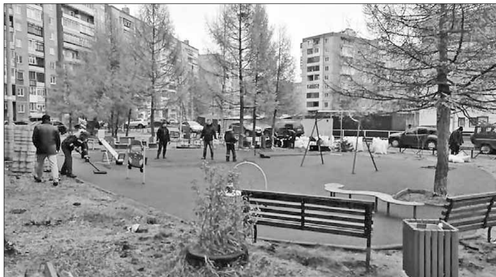
■ Благоустроенная дворовая территория – проспект Дзержинского, д. 29