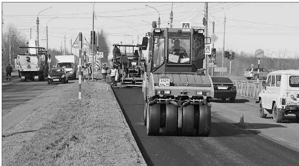
■ В рамках дорожного нацпроекта идет ремонт Маймаксанского шоссе